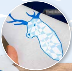
Standard vs. Reflex